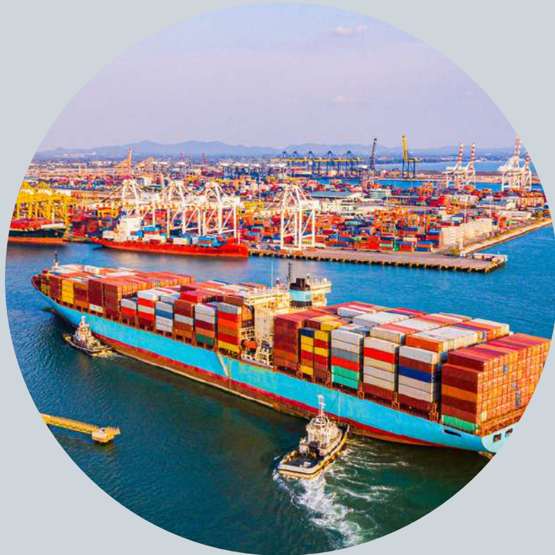
貿易事業 Export & Import