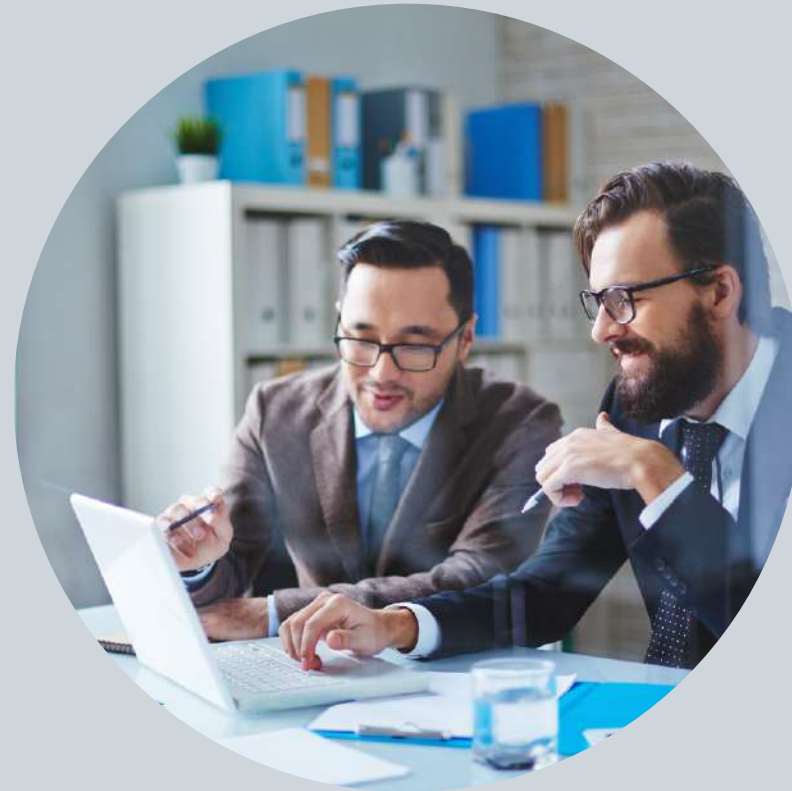
海外進出サポート Overseas Consultation